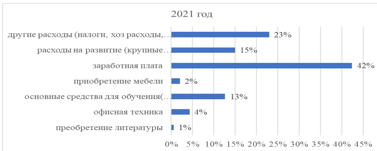
Рис.5. Средства, выделенные на обновление фонда в 2021 году