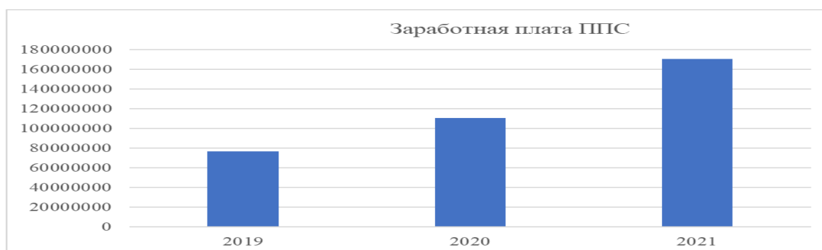
Рис.1 Динамика заработной платы ППС

Для повышения мотивации преподавательской деятельности, руководством университета, ежегодно улучшаются условия рабочих мест, повышается материально-технический уровень, наблюдается рост уровня заработной платы ППС. Повышение уровня зарплаты профессорско-преподавательского состава отражено в диаграмме 1.