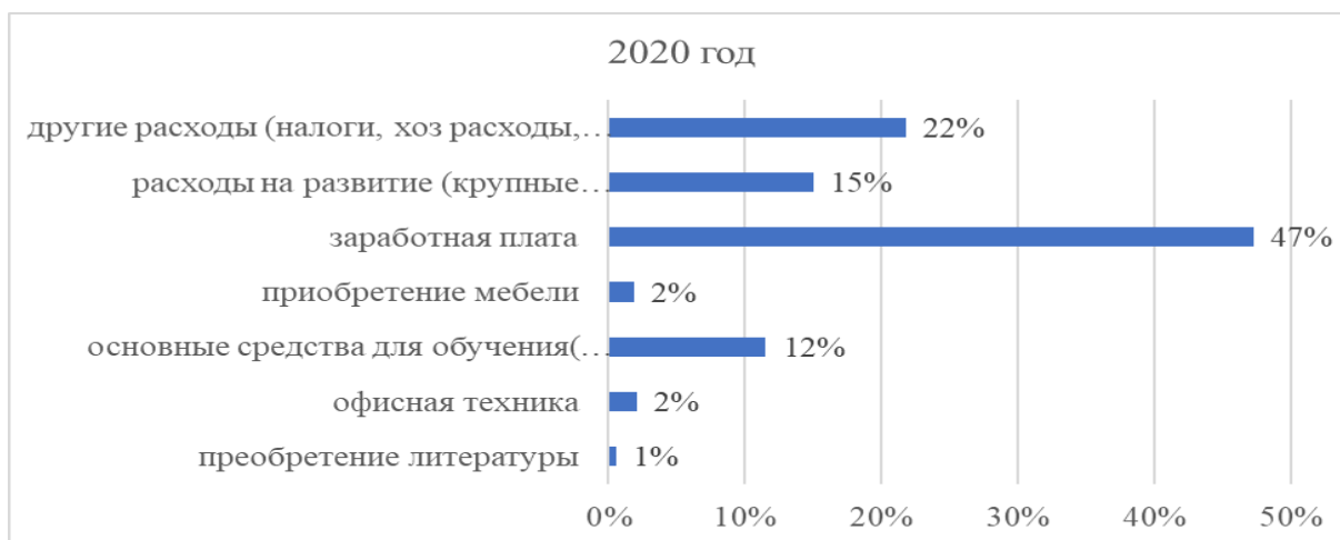
Рис.4. Средства, выделенные на обновление фонда в 2020 году